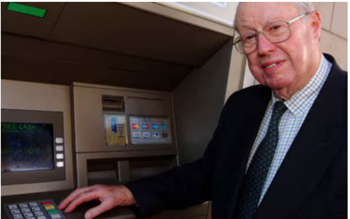
John Shepherd-Barron

Do koncepcji budowy bankomatu wrócił w latach 60. XX wieku inny wynalazca John Shepherd-Barron . To on opracował prototyp urządzenia, które działało na karty z paskiem magnetycznym i mogło wypłacać klientom pieniądze całą dobę, niezależnie od godzin pracy banku.