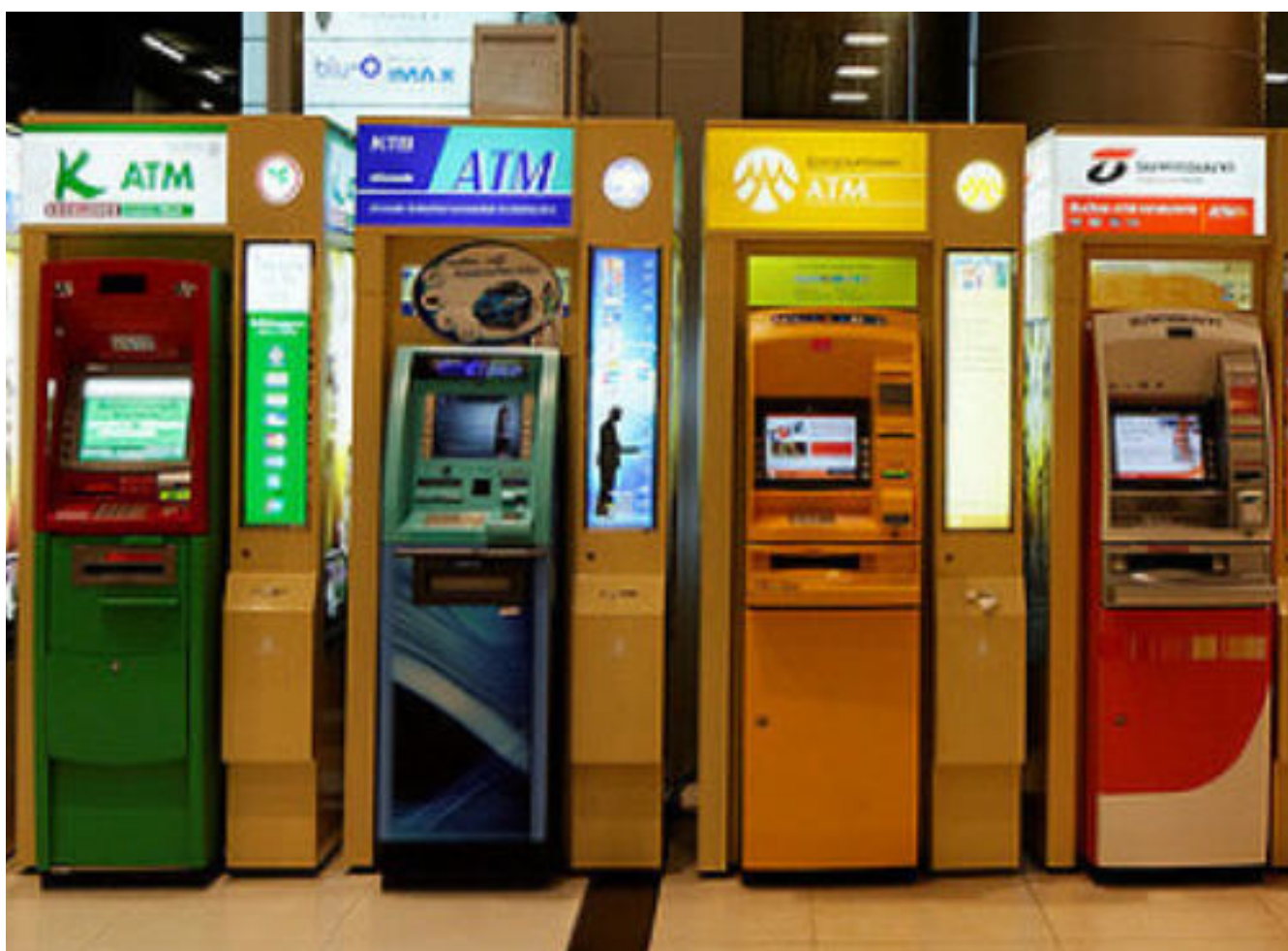
Różne rodzaje bankomatów.

Obecnie bankomaty można spotkać prawie na każdym kroku. Pierwsze bankomaty wyposażone były w czarno-białe ekrany, a ich funkcjonowanie było powolne i urządzenia te często ulegały awariom. Dziś wszystkie nowe bankomaty znajdujące się na rynku oparte są o technologie stosowane w najnowszych komputerach, a liczba bankomatów w Polsce i na świecie ciągle rośnie.